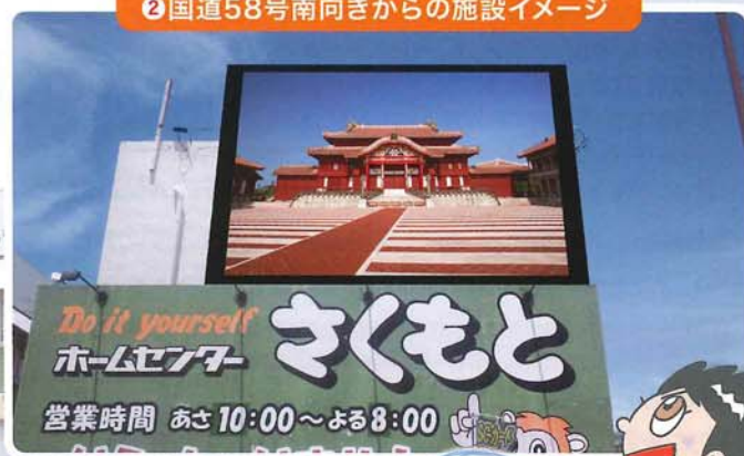
② 国道58号南向きからの施設イメージ