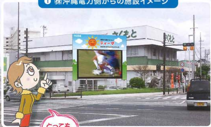
① 株沖縄電力側からの施設イメージ